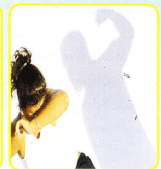
สำนักงานรักษาความปลอดภัยและสวัสดิภาพบุคลากร