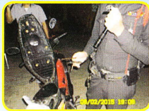
สำนักงานรักษาความปลอดภัยและสวัสดิภาพบุคลากร