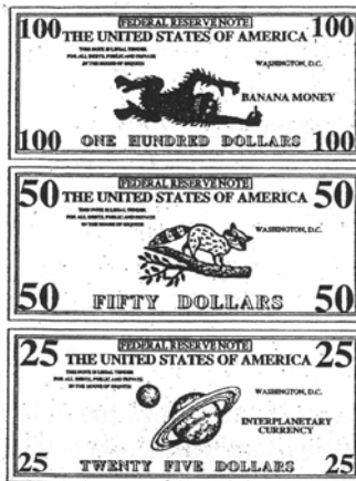
อาศัยคอมพิวเตอร์ช่วยนิดหน่อย ห้อง 56 ก็มีบัตรของห้องใช้เอง!

เมื่อทำงานแล้วเด็กๆ ก็จะได้รับเงินเดือนเป็นเช็ค ซึ่งพวกเขาจะนำไปฝากไว้กับนายธนาคาร พวกเขาต้องเก็บหอมรอบริบเพราะเด็กนักเรียนต้องจ่ายค่าเช่าที่นั้งเรียน ยิ่งนั่งใกล้หน้าชั้นเรียน ค่าเช่าก็จะยิ่งแพง อย่างที่ผมกล่าวไว้อย่างละเอียดใน There Are No Shortcuts มีวิธีการมากมายที่จะหารายได้พิเศษ เช่น ถ้าเด็กทำงานพิเศษหรือเข้าร่วมวงดุริยางค์ของโรงเรียน เด็กก็จะได้รับเงินโบนัส อย่างไรก็ตามถ้าเด็กไม่ทำงานหรือทำงานอึดอาด เจ้าหน้าที่ตำรวจจะปรับพวกเขา นักเรียนจะจ่ายเป็น “เช็ค” หรือ “เงินสด” ของห้องก็ได้ ทุกวันนี้การใช้เช็คอาจจะล้าสมัยไปแล้ว แต่ผมก็ยังสอนให้เด็กเขียนเช็คอยู่ พอสิ้นเดือน นักเรียนทั้งชั้นจะเข้าร่วมในการประมูลซึ่งจะมีอุปกรณ์การเรียนและบัตรแลกของขวัญจำหน่ายมากมาย