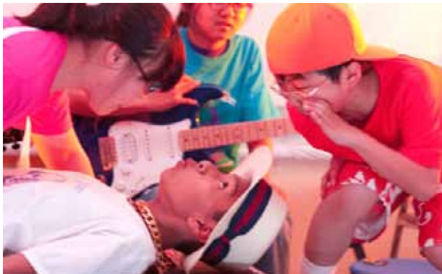
การแสดงละครเรื่อง The Comedy of Errors ในห้อง 56 เมื่อเดือน มิถุนายน 2010

ผมไม่ทำอะไรเลย และแม้ในยามที่ผมเหนื่อยอ่อนจนไม่อยากคิดอะไร สิ่งที่เด็กๆ ช่วยกันทำในครานั้นเต็มพลังใจให้ผมมาโรงเรียน แต่เข้าได้ทุกวัน แน่นนอน หลายสิ่งหลายอย่างอาจผิดพลาดได้ในชีวิตคนเรา มันผิดพลาดเสมอแหละ แต่ห้อง 56 ของเราก็เต็มไปด้วยนักแก้ปัญหา จริงอยู่การเตรียมการสอนในช่วงโมงก่อนเวลาที่ชั้นเรียนจริงจะเริ่มต้องใช้เวลาเพิ่มขึ้นบ้าง แต่การสอนให้เด็กๆ คิดและแก้ปัญหาเป็นของขวัญที่ดีที่สุดที่เราสามารถมอบให้พวกเขา ไม่ว่าพวกเขาจะเลือกชีวิตแบบไหน พวกเขา ก็จะพร้อมฟันฝ่าความโหดร้ายของโชคชะตาไปจนได้