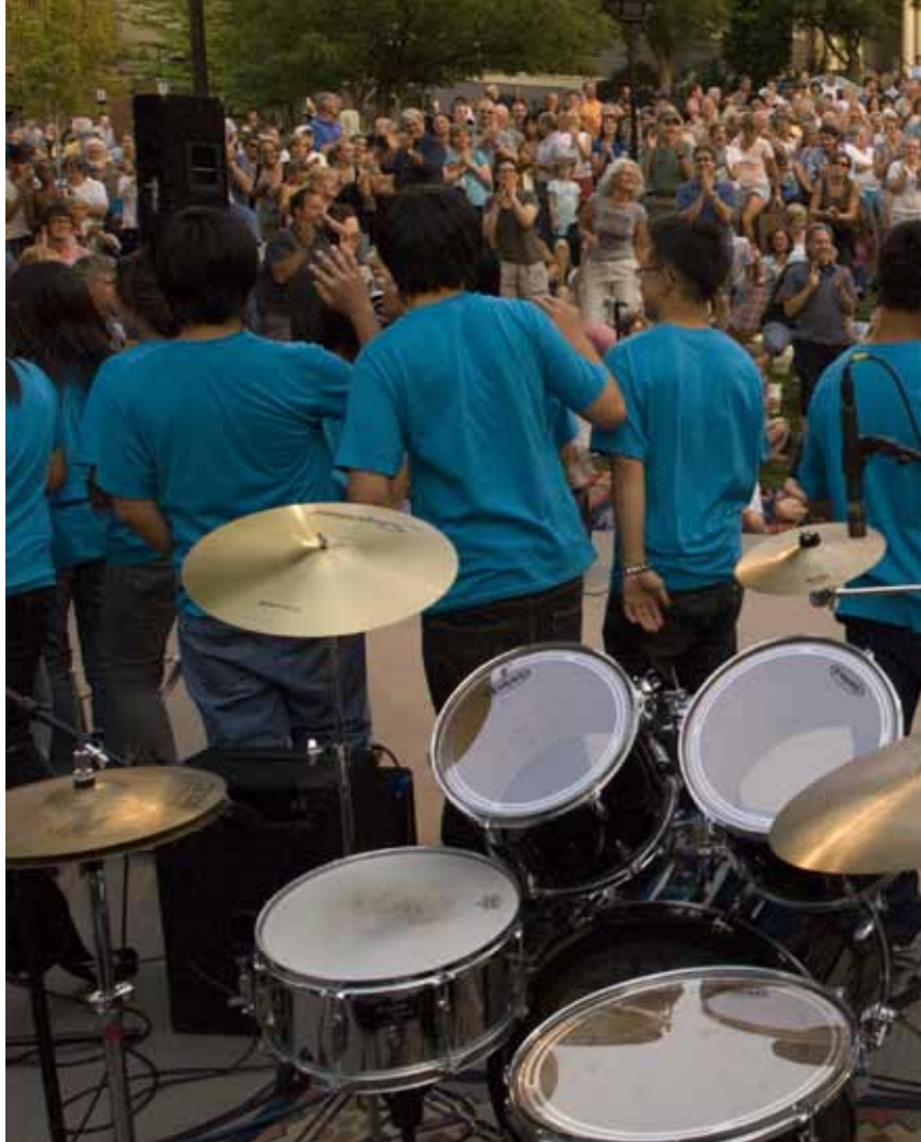
ผู้ชมลุกขึ้นยืนปรบมือชื่นชมคณะละครเพลงเปียร์แห่งโอบาร์ตที่แอชลันด์