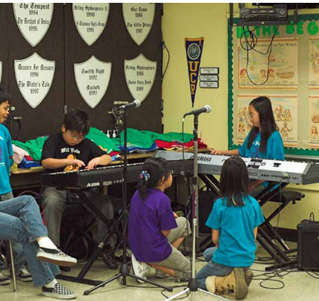
เด็กๆ เล่นเครื่องดนตรีได้หลายชิ้นและหลายสไตล์ ที่สำคัญพวกเขาเข้าใจดนตรีที่เขาเล่น