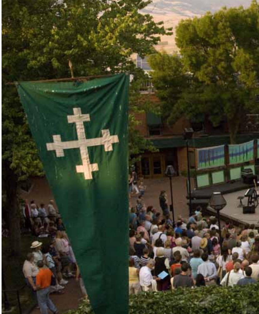
ผู้ชมรอชมการแสดงของคณะละครเชกสเปียร์แห่งไฮบาร์ท แน่นเวทียูคเอลิซาเบทที่ 1 ที่โอเรกอนเชกสเปียร์เฟสติวัล ในแอชลันด์