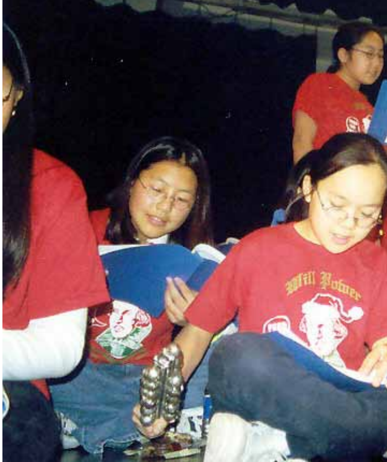
สมาชิกคณะละครเชกสเปียร์แห่งโฮบาร์ตทั้งรุ่นเก่าและรุ่นปัจจุบันจะกลับมาพบกันทุกวันที่ 24 ธันวาคม เพื่อสร้างความสุขให้คนไร้บ้าน