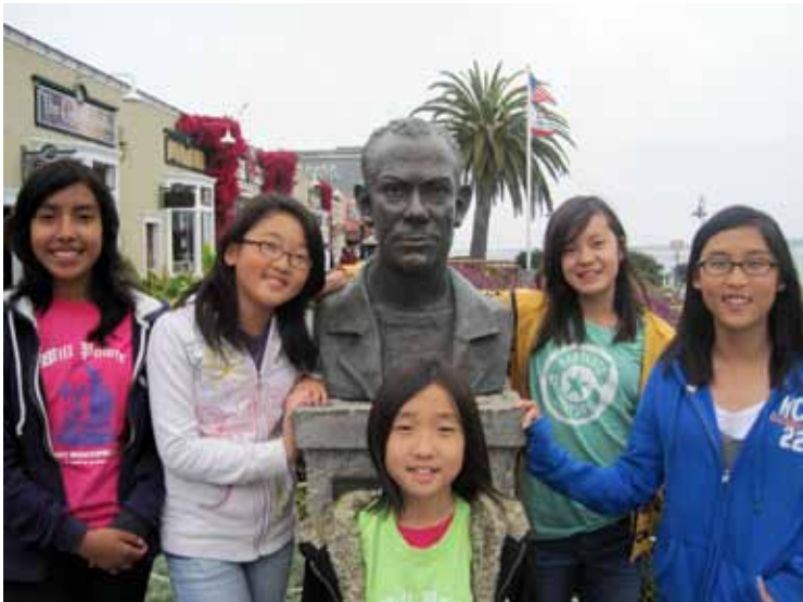
กระทปไหลส์จอห์น สไตน์เบก นักเขียนรางวัลโนเบลและพูลิตเซอร์

โอย นี่เป็นเด็กหญิงตัวน้อยที่ต้องการความรักและความเอาใจใส่ ผมจะไม่มืวันรู้ได้เลยถ้าไม่ได้อ่านเรื่องของเธอ เธอเป็นเด็กเงียบ น่ารัก แต่ช้อายเสียจนไม่กล้าออกจากห้องเรียนไปเล่นที่สนาม เรื่องของเธอเองที่ตลใจให้ผมเป็นคนที่ยอมเสียเวลาไปเก็บลูกบอลมาทำความสะอาด แล้วเอาไปคืนเธอ เราผ่านพ้นปีนั้นมาด้วยกันอย่างมีความสุข ตอนที่เธอจบการศึกษา ผมให้ลูกบอลสีแดงเป็นของขวัญแก่เธอด้วย เรายังสนิทกันแม้เวลาผ่านไป 20 ปีแล้ว ปัจจุบันเธอเป็นนักกฎหมาย ส่วนหนังสือนักเขียนน้อยเรื่องลูกบอลสีแดงของเธอก็วางอยู่กับหนังสือกฎหมายบนชั้นหนังสือในห้องทำงานของเธอ