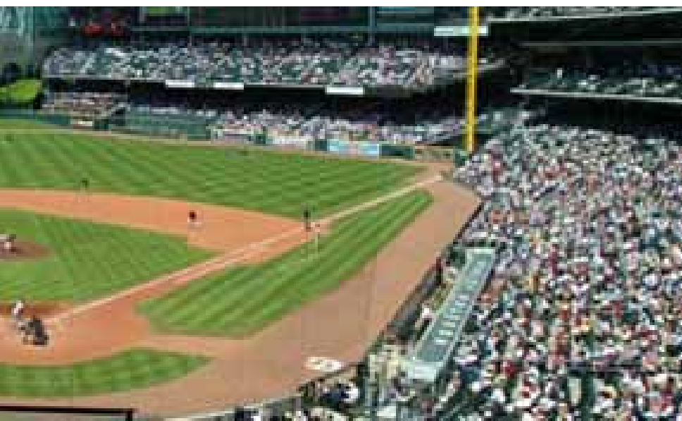
สนามแข่งเบสบอลมินิเมตพาร์ก เมืองฮิวสตัน

เมื่อ 2-3 ปีก่อน ตอนที่โรงเรียนของเรามีโปรแกรมพลศึกษา เป็นเรื่องเป็นราว ทางโรงเรียนได้จัดการแข่งขันวอลเลย์บอลขึ้น เนื่องจากนักเรียนของผมได้ฝึกมาอย่างมีวินัยและพื้นฐานที่ดี ห้อง 56 จึงได้ถล่มทุกห้องที่เล่นด้วย ไม่เว้นกระทั่งห้องที่มีทีมรวมดาว ครูคนหนึ่ง มาหาผมวันหลังจากที่ห้องของเธอถูกคณะละครเชกสเปียร์แห่งไฮบาร์ต ถล่มยับ นักเรียนคนหนึ่งของเธอบอกอะไรบางอย่างที่เธอคิดว่าน่าสนใจ มาก และอยากเล่าให้ผมฟัง “เราไม่ว่าอะไรหรอกที่แพ้ห้องของครูเรฟ” เด็กบอก “เพราะพวกเขาน่ารัก” ครูคนนั้นบอกผมว่าเธอคิดว่านักเรียน ของผมเป็นคนพิเศษ เธอพูดถูก!