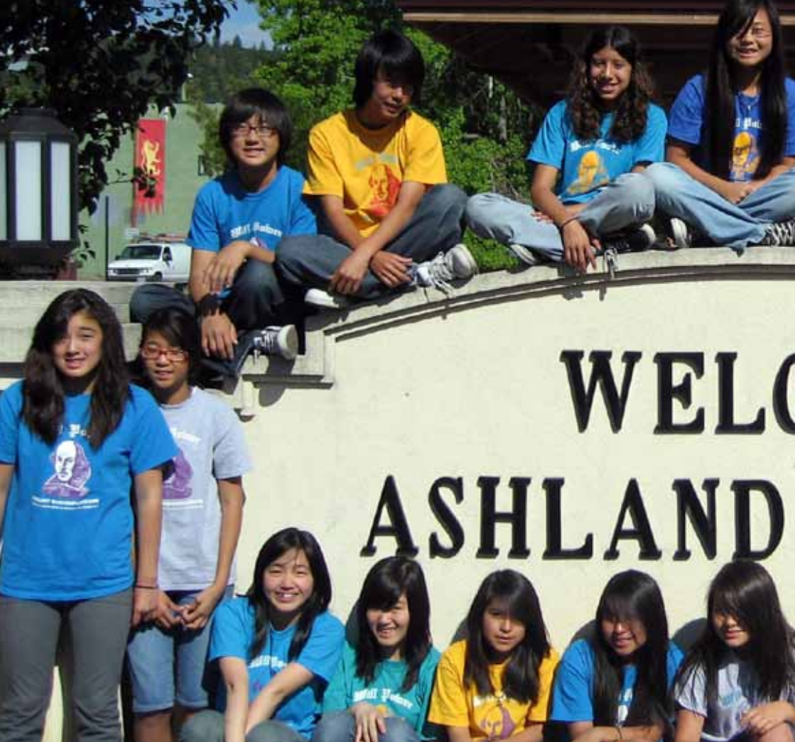
คณะละครเซกสเบียร์แห่งโฮบาร์ตเดินทางไปแสดงละคร ที่โอเรกอนเซกสเบียร์เฟสติวลในแอชแลนด์เป็นประจำทุกปี