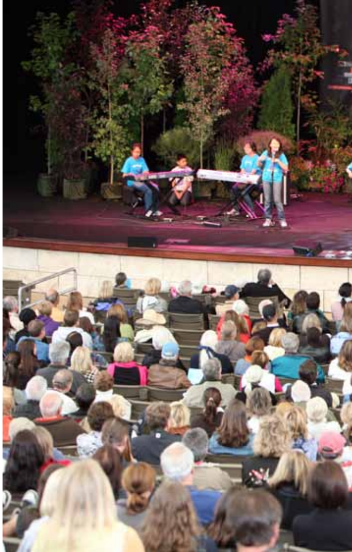
ระเบิดเพลงร็อก "Runaway" ในงาน Sun Valley Writers' Conference ที่โอดาโฮ ปี 2010