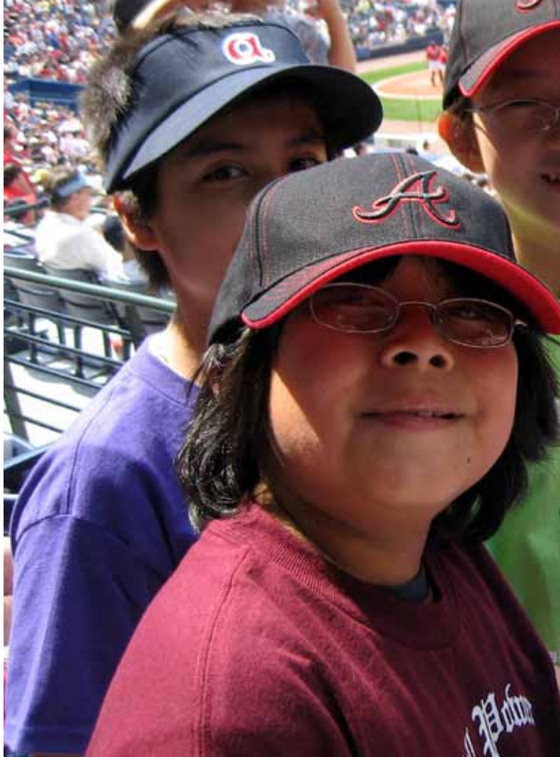
การพาเด็กๆ ไปดูกีฬาเป็นโอกาสดีที่จะสอนเรื่องของน้ำใจนักกีฬา