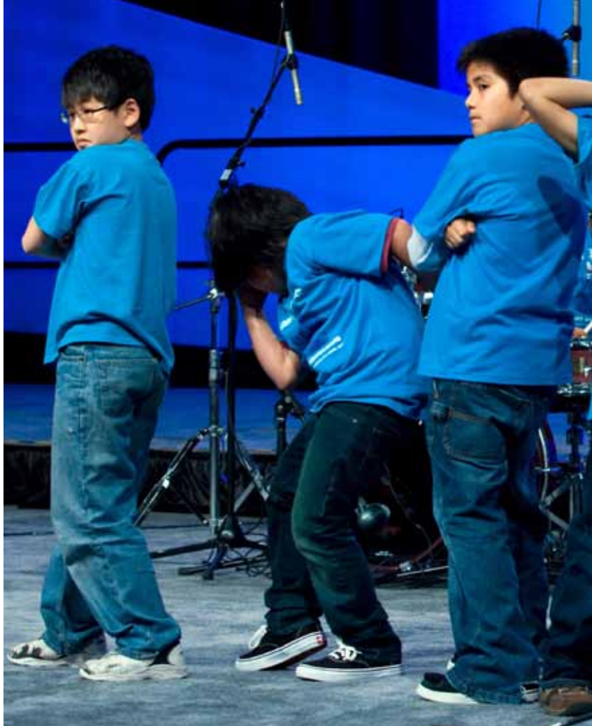
ลีลาประกอบดนตรีของเดอะโรลลิงสโตนในงาน International Reading Association ที่เมืองแอตแลนตา