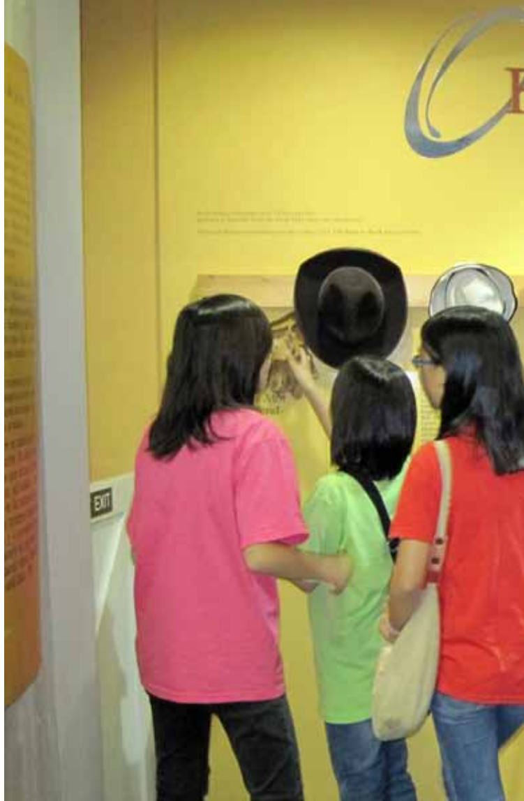
เด็กๆ ตื่นเต้นกับของใช้ของจอร์จและเลนนี่ ตัวละครที่นักอ่านน้อยเหล่านี้ คุ้นเคยเป็นอย่างดี ที่เนชันแนลสไตน์เบกเซ็นเตอร์ (National Steinbeck Center) ซาลินัส แคลิฟอร์เนีย