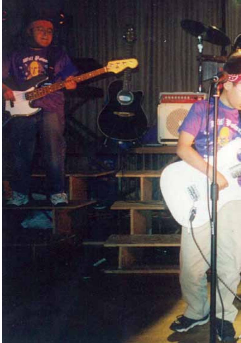
นักร้องรุ่นเยาว์เขย่าอารมณ์ผู้ชม และสร้างสีสันให้กับละครของเทศบาลเป็ยร์