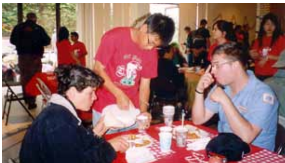
เด็กๆ เรียนรู้ที่จะเห็นใจและช่วยเหลือผู้ด้อยโอกาส คุณธรรมนี้จะหยั่งรากลึกอยู่ในตัวพวกเขาเมื่อเติบโตเป็นผู้ใหญ่