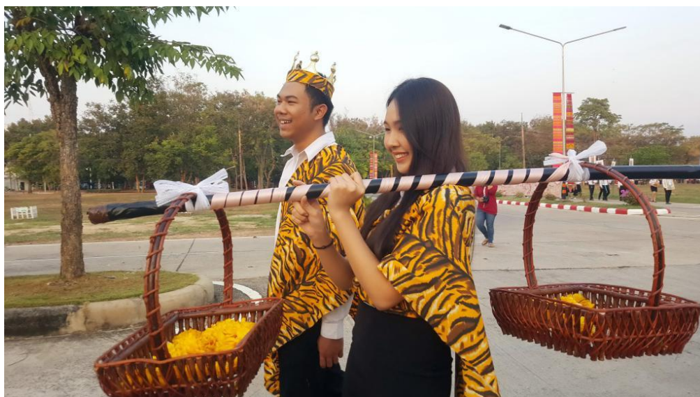
รายงานผลการประเมินโครงการสร้างสรรค์ศิลปะ สามีศศิกันเกรา น้องอ้ายเต้าเอาบุญแพะหวัด