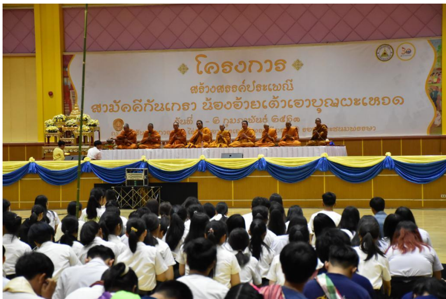
รายงานผลการประเมินโครงการสร้างสรรคิ์ประเพณี สวมักคิ์กันเกรา นื่องอ้ายเต้าเอาบุญพะหวด