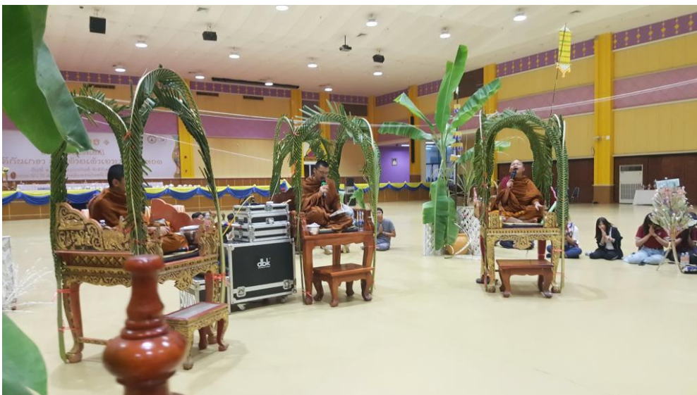
รายงานผลการประเมินโครงการสร้างสรรค์ศิลปะชนิ สามีคสิกันเกรา นื่องอ้าบเต้าเอาบุญพะแหวด