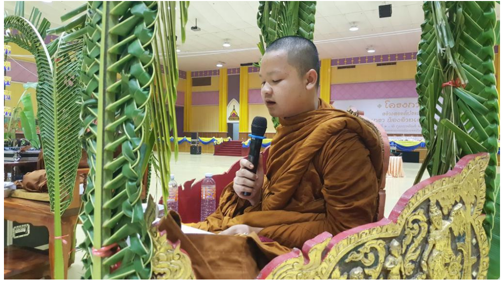
รายงานผลการประเมินโครงการสร้างสรรค์ศิลปะเพื่อ สามีศศิกันเกรา น้องอ้ายเต้าเอาบุญพะหวด