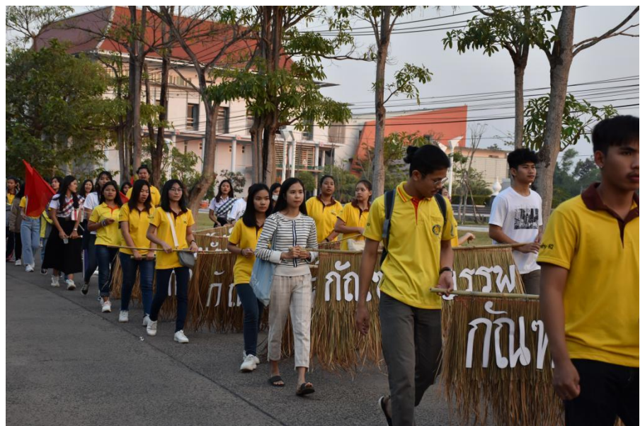
รายงานผลการประเมินโครงการสร้างสรรค์ประเพณี สยามคสิกันเกรา น้องอ้ายเต้าเอาบุญพะเนาะต