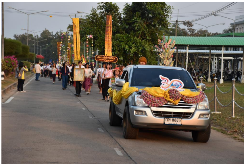
รายงานผลการประเมินโครงการสร้างสรรค์ศิลปะ สยามคสิกันเกรา น้องอ้ายเต้าเอาบุญพะหวด